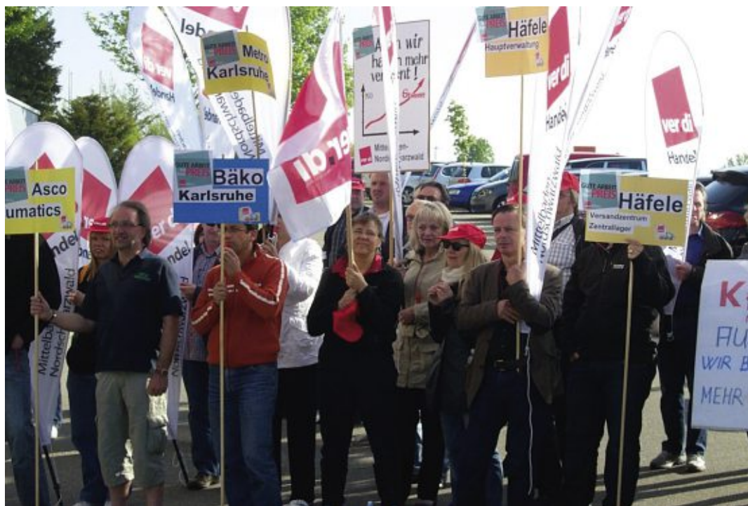
19.4.2011: Protest vor dem Verhandlungslokal

Es ist an der Zeit, dass endlich auch die Beschäftigten an der guten wirtschaftlichen Entwicklung der Branche beteiligt werden. Während die Unternehmen seit 2000 ihre Gewinne kräftig erhöht haben, konnten die Realeinkommen