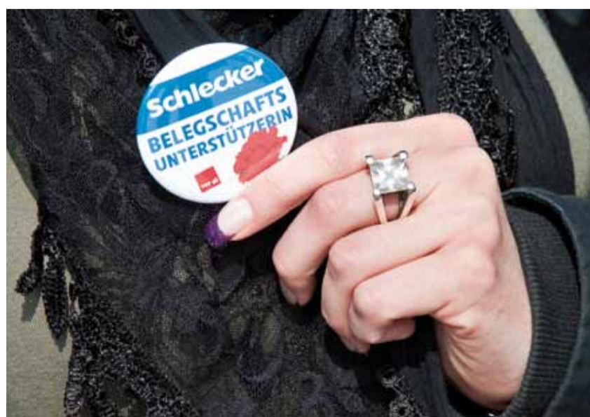
Ein in diesen Tagen viel getragener Solidaritätsbutton