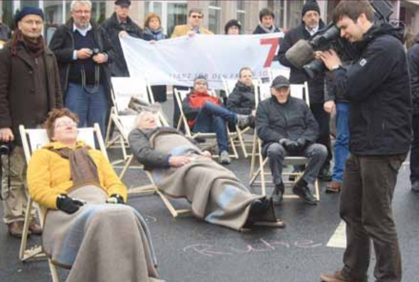
Mit einem »Ruhe-Mob« auf einer der verkehrsreichsten Kreuzungen Fuldas sorgten die Sonntagsaktivisten für Aufmerksamkeit

Die Allianz für den freien Sonntag ist in mittlerweile acht Bundesländern und ca. 80 Regionen in Deutschland aktiv. Seit 2011 gibt es auch eine »European Sunday Alliance«. AHA