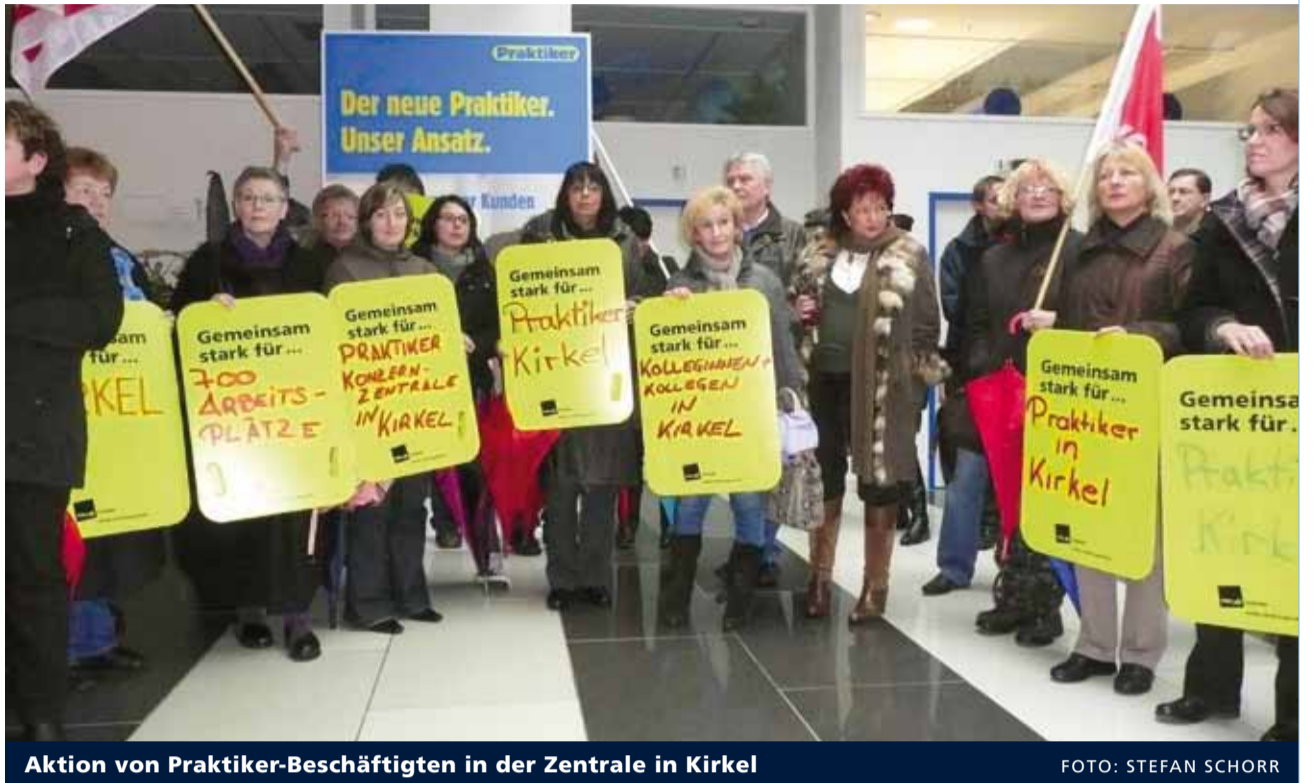
Aktion von Praktiker-Beschäftigten in der Zentrale in Kirkel

Unterdessen setzt die Konzernspitze ihr Restrukturierungs- und Sanierungskonzept um und trifft dabei zum Teil auf deutliche Widerstände. Begonnen hat der Umzug der Firmenzentrale von Kirkel im Saarland nach Hamburg zur profitablen Tochter Max Bahr. Die auch von ver.di und dem saarländischen Landesparlament heftig kritisierte Maßnahme soll im Herbst vollzogen sein. Auf Ablehnung stößt insbesondere der damit verbundene Personalabbau. Wie berichtet, könnten durch das Restrukturierungskonzept insgesamt etwa 2.000