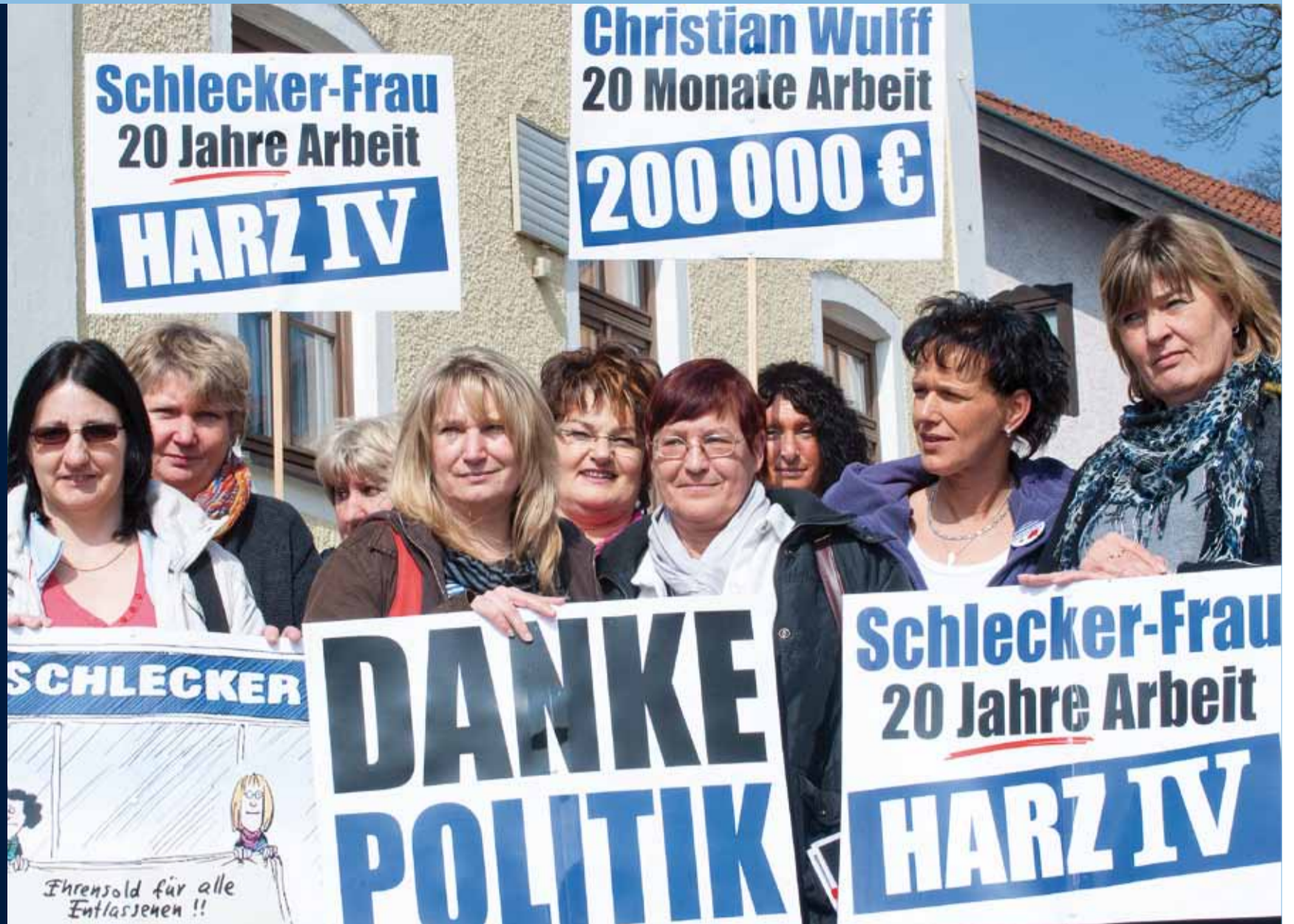
Schlecker-Verkaufsbezirk Pfarrkirchen (Bayern): Protest gegen Schließungen und Kündigungen