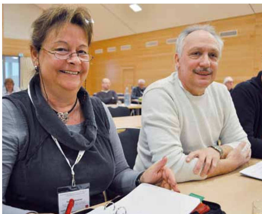
Edeka-Betriebsratsmitglieder bei der Tagung in Willingen

großen Andrang von interessierten Betriebsräten. Auf ebenfalls großes Interesse traf der Beitrag zum Beschäft-