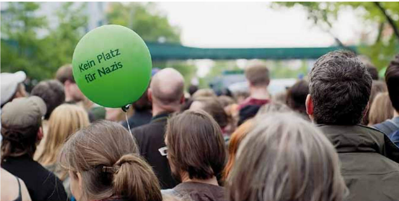
Aktion gegen Neonazis

Inzwischen hat sich der grüne Papierkoffer absolut bewährt. Das griffige Infopak, das auch eine DVD und die Broschüre »Versteckspiel« über Symbolik rechtsextremer Gruppierungen enthält, gelangte etwa 2500 Mal kostenfrei an