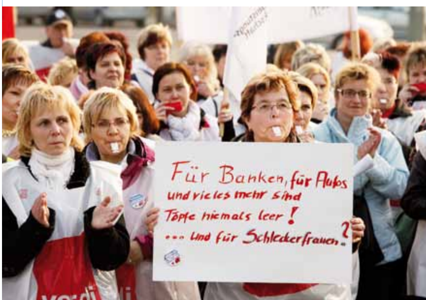
Aktion aufgebrachter Schlecker-Frauen unter dem Fernsehturm in Berlin

Am 13. April sind in Bielefeld die BigBrotherAwards 2012 verliehen worden. Dieser Negativpreis für Be-spitzelung ging in der Kategorie Arbeitswelt an Bofrost, die größte Zustellfirma von Tiefkühlkost. Begründet wurde dies von der unabhängigen Jury mit der rechtswidrigen Ausforschung von Daten auf Betriebsratscomputern, z.B. mit einer Fernsteuerungssoftware (wir berichteten). Bofrost habe heimlich Dateien des Betriebsrats ausgewertet und ein dabei gefundenes Schreiben verwendet, um einem Betriebsratsmitglied zu kündigen. www.bigbrotherawards.de