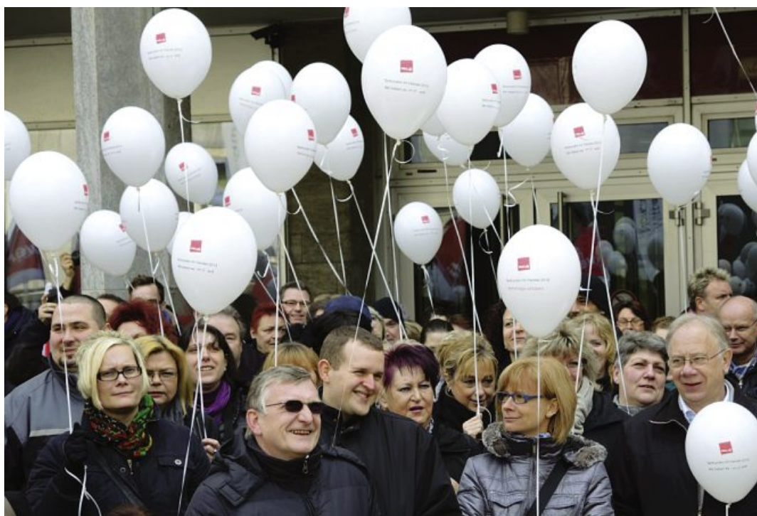
14.3.2013: Betriebsräte-Konferenz in Stuttgart

Die Beschäftigten haben es verdient, endlich gerecht an den satten Gewinnen der Unternehmen beteiligt zu werden.