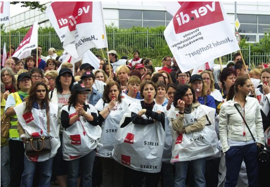
9.6.2011: Kundgebung vor dem Verhandlungslokal

Die Kündigung des Manteltarifvertrages durch die Arbeitgeber zum 30. April stößt auf große Empörung in den Betrieben.